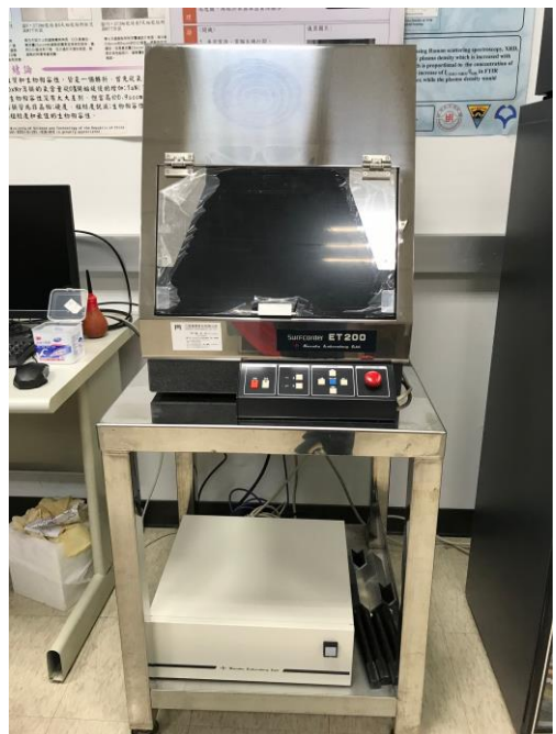
上方為輪廓儀機器,下方為機台電源與電腦主機。