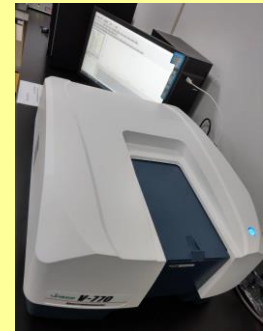
紫外光/可見光分光光譜儀